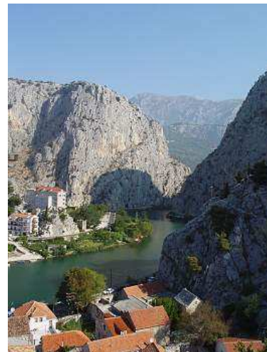
Omiš, soutěska řeky Cetiny.

Město (v roce 2004 zde žilo 15 800 obyvatel), 26 km jihovýchodně od Splitu. Textilní a zpracovatelský průmysl, rybářství a zemědělství. Průmyslové podniky v blízkosti (cementárna a další), které znečišťovaly ovzduší, byly v posledních letech přestěhovány nebo zrušeny. Blízko ústí Cetiny do moře vodní elektrárna Zakučac .