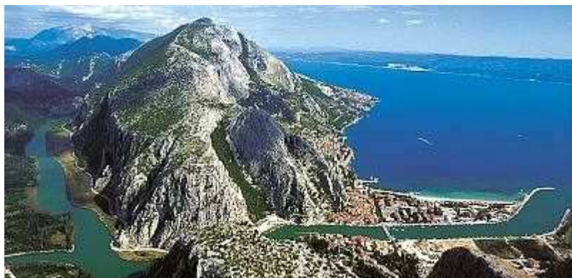
Omiš od severozápadu, vlevo řeka Cetina.